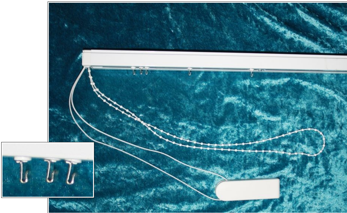
Aufhängeschiene weiss mit Edelstahlhaken